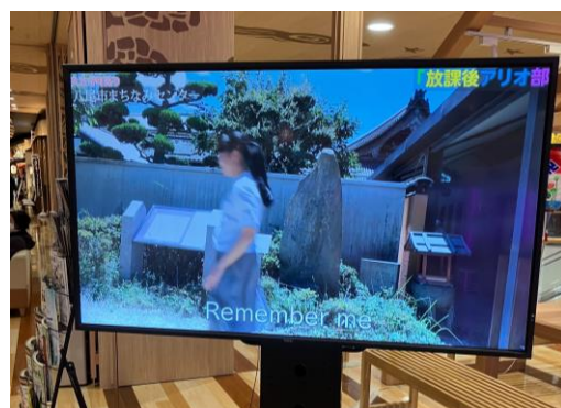
⑥ 70インチ /横中型/非固定式 ※使用規制あり