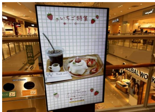
⑤ 49インチ /横小型/非固定式