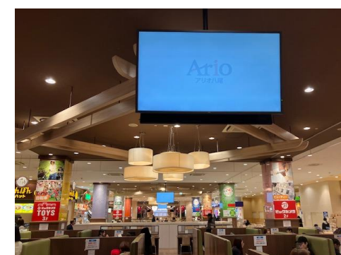
④ 55インチ /横小型/固定式