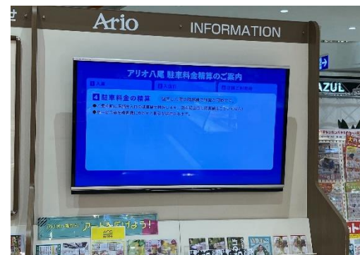
③ 60インチ /横小型/固定式